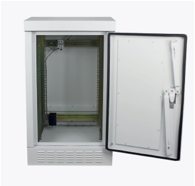
SZAFY ŚWIATŁOWODOWA RACK ODF-R-Z OUTDOOR 18U 19" v.2